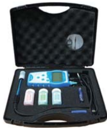
[ Full set 구성 ]