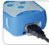
USB 데이터 출력