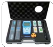
Full set 구성